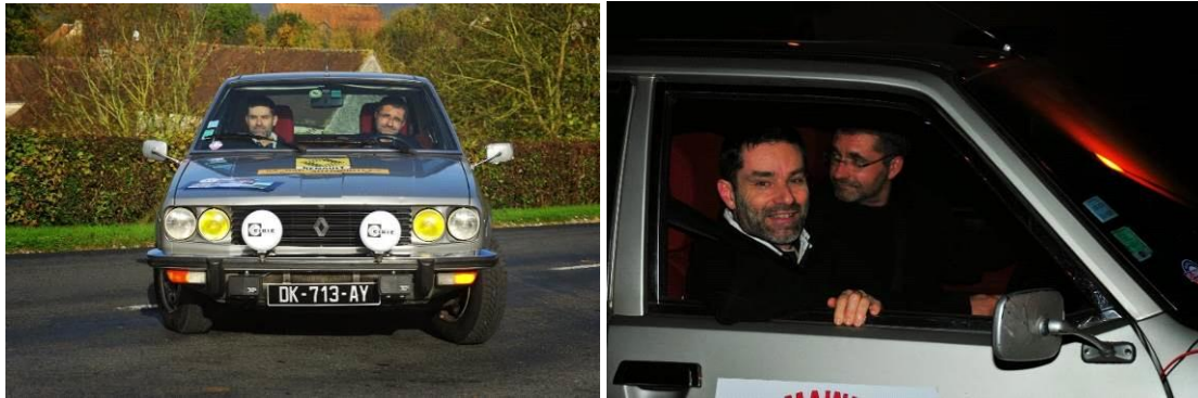
Rallye du Saônois 2014

Un équipage qui s'est déjà confronté au rallye de régularité avec le plus grand plaisir. L'envie de continuer, le plaisir de préparer et vivre les événements sportifs ne font que monter !