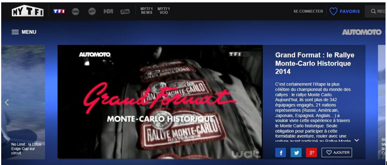
Reportages TV nationaux (Automoto TF1)