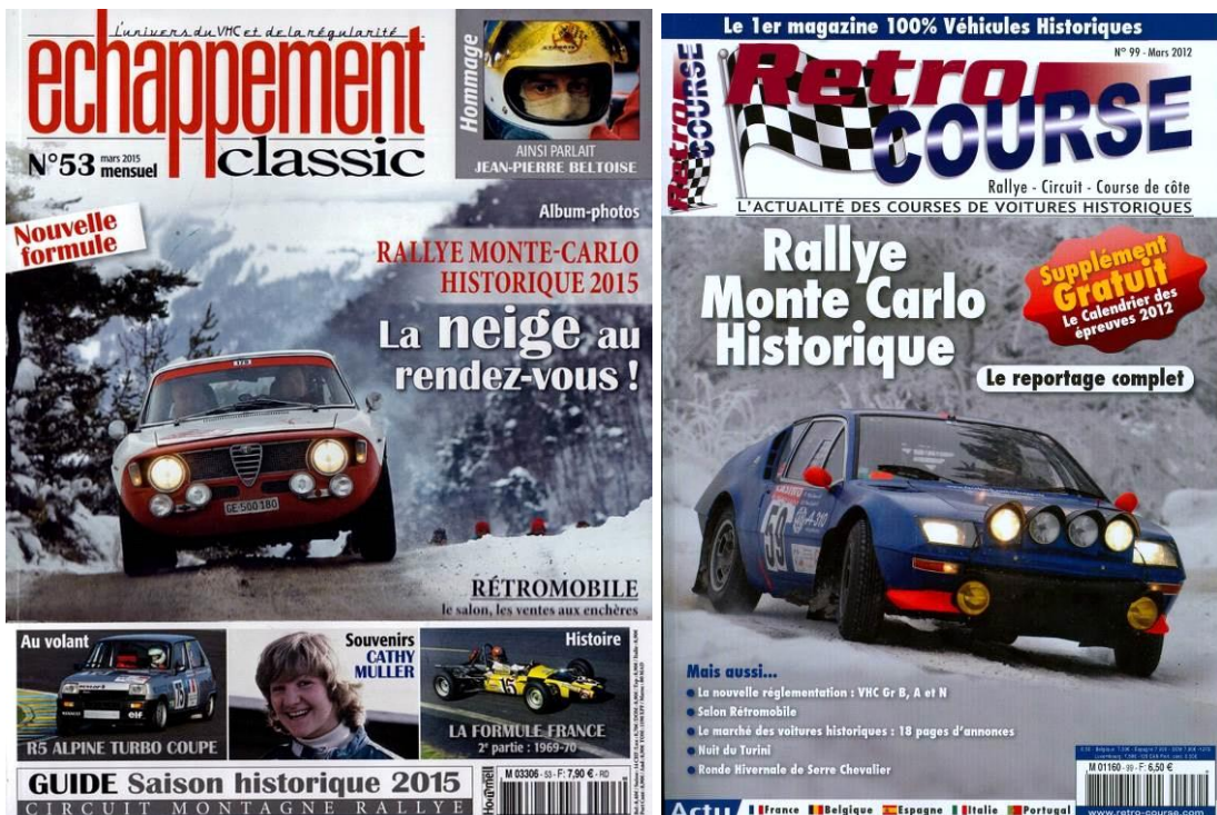
Quelques exemples de numéros spéciaux de la presse spécialisée

La présence du public et des médias régionaux lors du parcours et dans les villes étapes, les reportages photos et vidéos consultables sur Internet (Youtube, forum auto ...) et le site de l'Automobile club de Monaco permettent de suivre l'événement en direct.