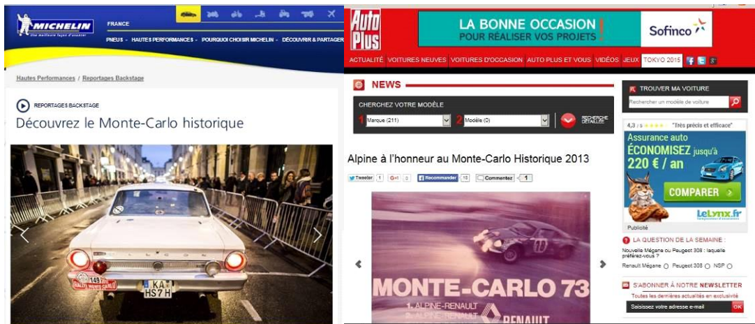
Sites automobiles commerciaux (Michelin) ou presse (Auto Plus)

A des fins de communication, nous disposons de quatre emplacements publicitaires réglementés par les organisateurs du Monte-Carlo selon les règles FIA :