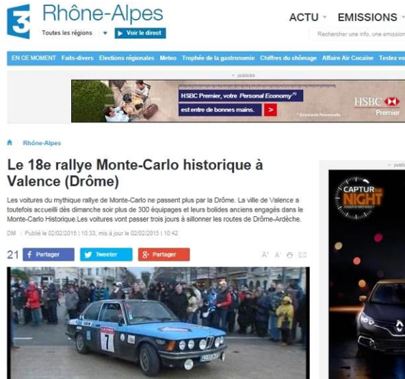
Reportages TV locaux (France 3)